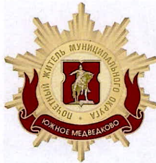
Рисунок нагрудного знака к званию «Почетный житель внутригородского муниципального образования – муниципального округа Южное Медведково в городе Москве»

Приложение 3 к решению Совета депутатов внутригородского муниципального образования – муниципального округа Южное Медведково в городе Москве от 20 февраля 2025 года № 02/4-СД